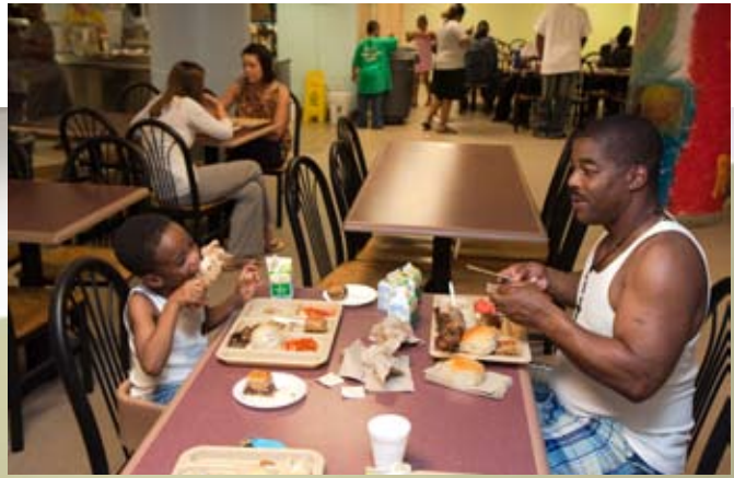
Vader en zoon Bailey in het opvanghuis van People Serving People